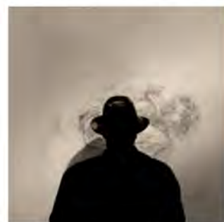
Einladung zur Ausstellung

Vernissage: Freitag, 03. November 2017, 18.00 Uhr Ausstellung: 04. November - 26. November 2017 Öffnungszeiten: Sa + So 14-18 Uhr Ort: Nerostrasse 32, 65183 Wiesbaden