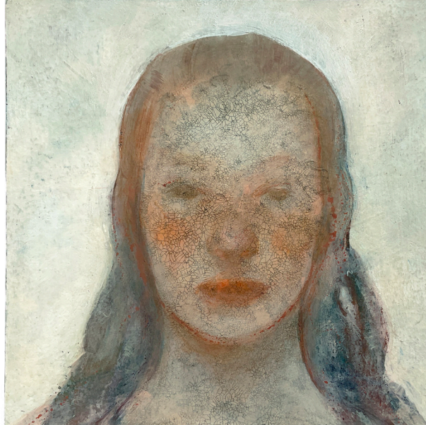
„Donika“ von Sara Weiponer